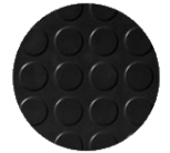
Pastilles (MC 2K1)