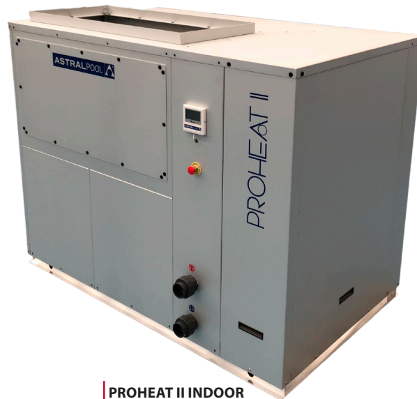
PROHEAT II INDOOR

La nueva PROHEAT II INDOOR es una bomba de calor utilizada para alargar la temporada de baño permitiendo el calentamiento de agua hasta 0°C de aire exterior.