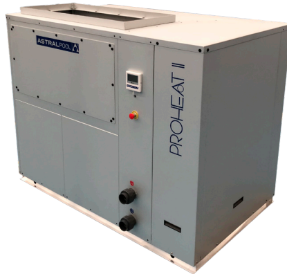
PROHEAT II INDOOR