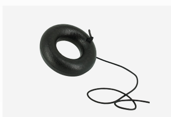
Aro flotante para sacar el dispositivo del agua