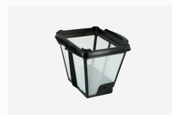
Filtro simple de 150 μ