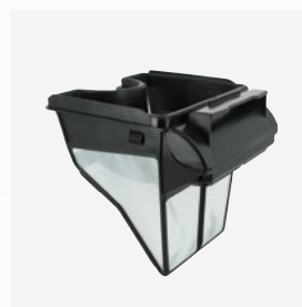
Bac filtrant de 100 µ