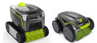
Roboter Robot GT3220/GV3420