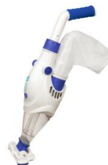
Elektrischer Bodenreiniger Electric vacuum VCB10