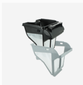
Vasca filtrante Filtro a due stadi: 150/60 µ