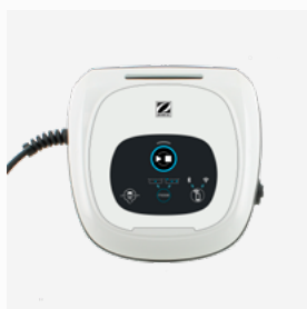
Scatola di comando