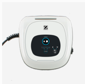
Quadro di comando