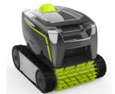
Roboter Robot GT2120 / GT3220