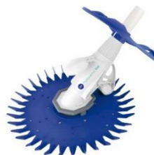
Automatischer Bodenreiniger Automatic cleaner 19007