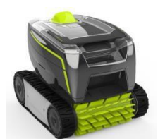
Roboter Robot GT2120