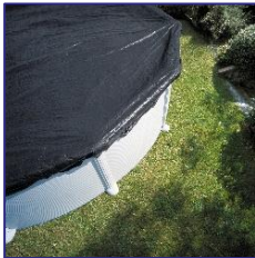
CIPR351 / CIPR351P Couverture d'hiver Winterafdekking