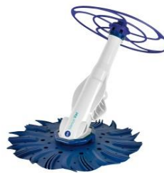
Automatischer Bodensauger Automatic cleaner 90397