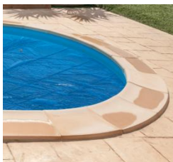
Isothermische Abdeckplane Isothermic cover CVPE700