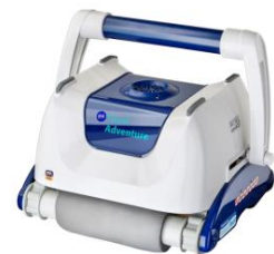
Roboter Robot RKA80