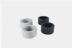
Kit reductores adhesivos