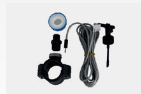
Kit detector de caudal