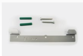
Kit montaje en pared