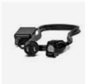
Carregador adequado para utilização no exterior