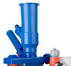
Limpiafondos Ventury Ventury vacuum 90111