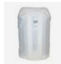
Funda de protección