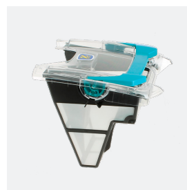
Filtro (3L) de fácil acceso