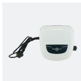
Unidad de control