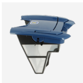
Filtro (3L) de fácil acesso