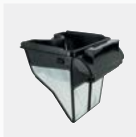
Bac filtrant de 100 µ