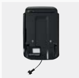
Station de charge et de rangement