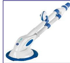
Nettoyeurs automatiques Automatische zwembadreiniger