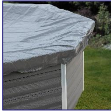
CIKPCOR46 Couverture d'hiver Winterafdekking