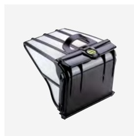
Filterbak (5 liter) Stevig, zeer fijn filter met grote inhoud