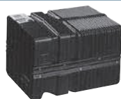
Condotto di attraversamento del muro