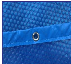
CVKPCOR28 Couverture isotherme Isothermische afdekking