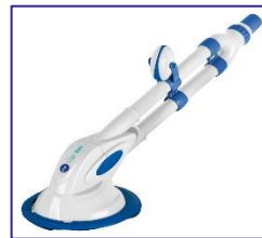
Nettoyeurs automatiques Automatische zwembadreiniger