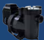
Victoria Plus Silent VS