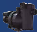
Victoria Plus Silent