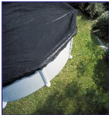
CIPR451/CIPR451P Winterabdeckung Winter cover