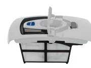
Bac filtrant débris fins 100µ