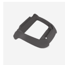
Voetstuk voor schakelkast