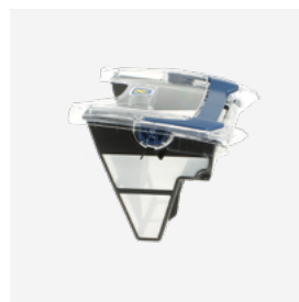
Filterbak (3L) eenvoudig te reinigen