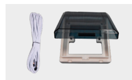
Kit de control a distancia