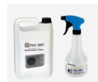
Reinigingsset voor warmtepompen PAC Net

De warmtepompen van Zodiac® zijn betaalbaar en gemakkelijk te installeren , en zijn de perfecte oplossing om uw zwembad te verwarmen. U kunt ze het hele jaar door gebruiken én energie besparen.