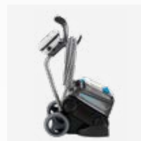
Carrello di trasporto