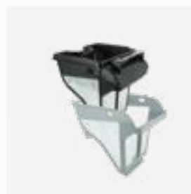
Vasca filtrante Filtro a due stadi: 150/60 µ