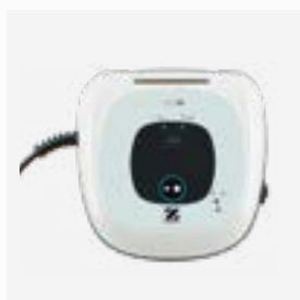
Scatola di comando