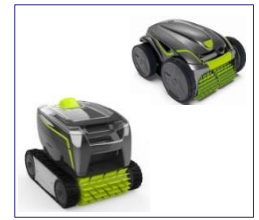
Robot Robot GT3220/GV3420