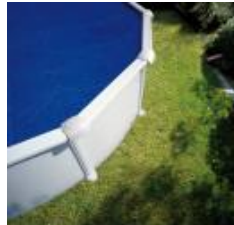
Isothermabdeckplane Isothermic cover CPROV600