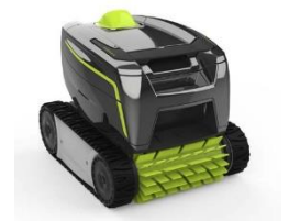
Roboter Robot GT2120