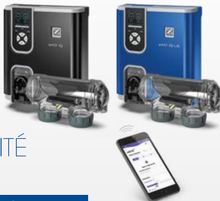
Modèles présentés avec les modules de régulation pH en option