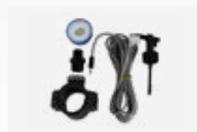
Kit détecteur de débit