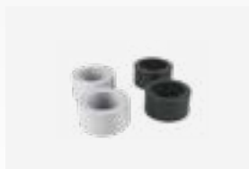
Kit réducteurs à coller