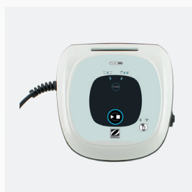
Quadro di comando