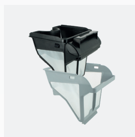
Cestello filtrante Filtro a due stadi: 150/60 µ