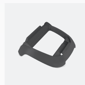
Base per scatola di comando