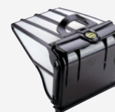
Filterbak (5 liter) Stevig, zeer fijn filter met grote inhoud