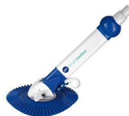
Limpiafondos automático Automatic cleaner AR20682