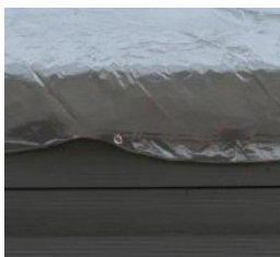
Cubierta de invierno Winter cover CIKPCO80