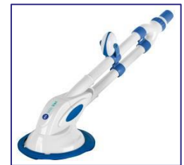
Nettoyeurs automatiques Automatische zwembadreiniger