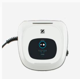
Quadro di comando