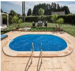
CVPE800 Bâche isotherme Isothermische afdekking