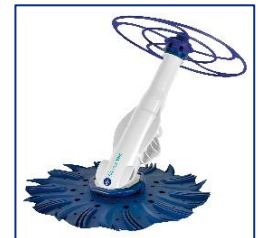
Nettoyeurs automatiques Automatische zwembadreiniger