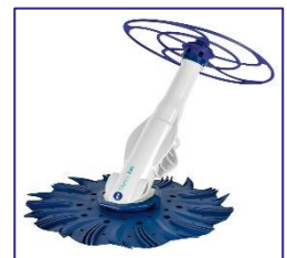
Nettoyeurs automatiques Automatische zwembadreiniger