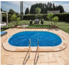
CVPE800 Sommer Abdeckplanne Summer Cover