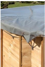
Couverture pour l'hiver Copertura invernale CI790210