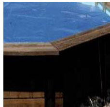
Couverture isothermes Copertura isotermica CV790210