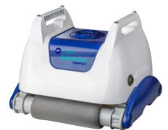
Robot Robot RKA80C