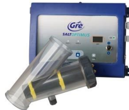
Electrolyse au sel Elettrolisi salina ESP30