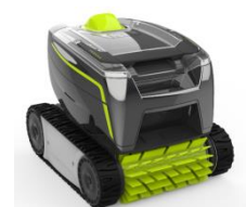
Roboter Robot GT2120