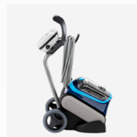
Carro de transporte