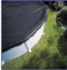
CIPR351 / CIPR351P Couverture d'hiver Winterafdekking