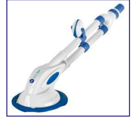
Nettoyeurs automatiques Automatische zwembadreiniger