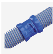
Twist Lock Schläuche