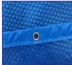
CVKPCO52 Couverture isotherme Isothermische afdekking