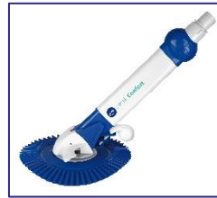
Nettoyeurs automatiques Autmatische zwembadreiniger