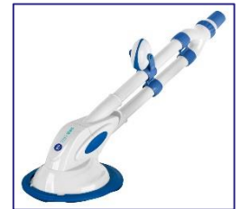
Nettoyeurs automatiques Automatische zwembadreiniger