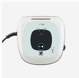
Unidad de control