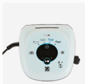
Scatola di comando