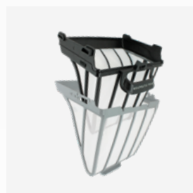
Filtro detriti largo 150µ per Doppia filtrazione o solo uso Filtro ultra fine 60µ per uso in Doppia filtrazione