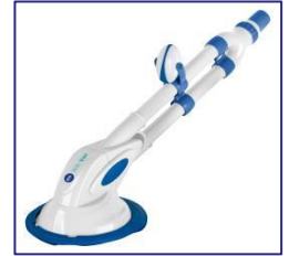
Automatischer Reiniger Automatic cleaner